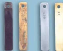
實證三：鋼鐵腐蝕測試